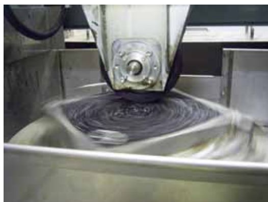
写真: 混合物のねじれ試験状況