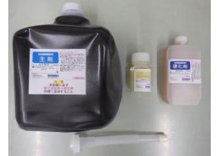
写真-3 パウチタイプ 写真-4 バロンタイプ