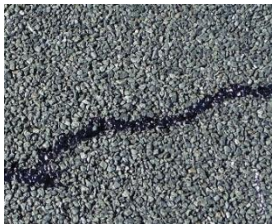
写真-1 浸透型クラックシール材を注入後の排水性舗装路面