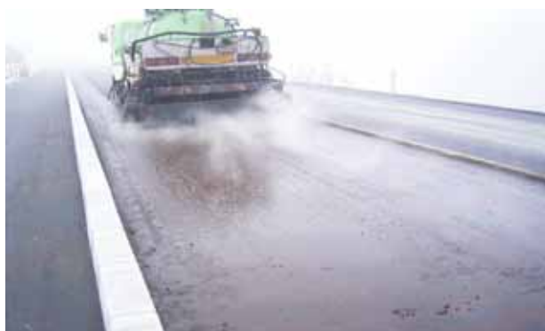
散布状況（ディストリビュータ）