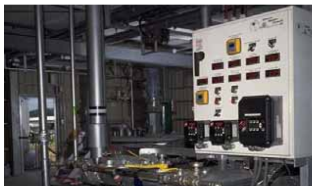
昭瀝乳剤製造装置（SSM）