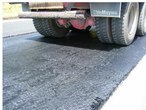
タイヤへの付着低減状況